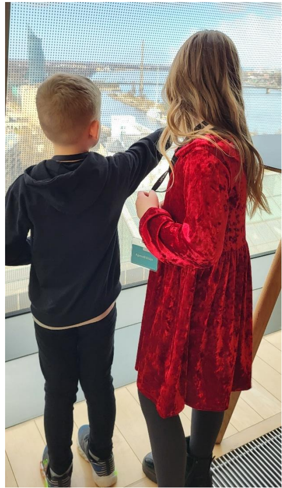
Ogresgala BJVŽ – 2023 pārstāvji Lielajos lasīšanas svētkos LNB un balviņas mazajiem ekspertiem