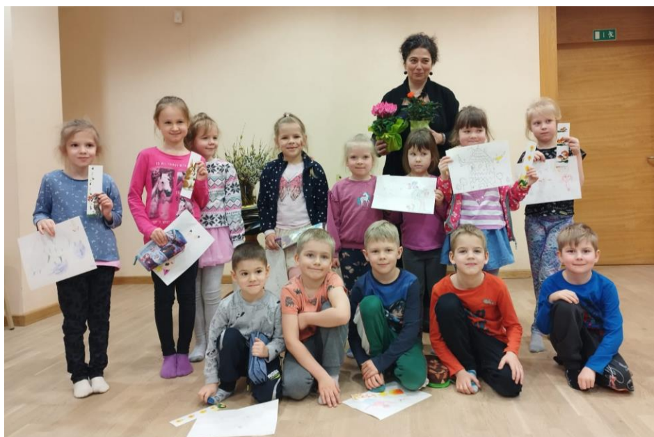
Mākslinieces un grāmatu ilustratores viesošanās pie Ogresgala pamatskolas un PII "Ābelīte" BJVŽ – 2023” grāmatu lasīšanas ekspertiem.