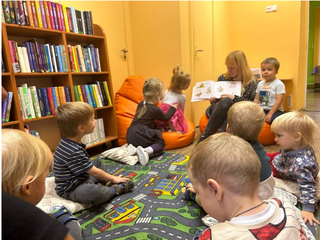
Attēls nr. 4 – Nodarbība PII “Saulīte” Cālīšu grupīnai