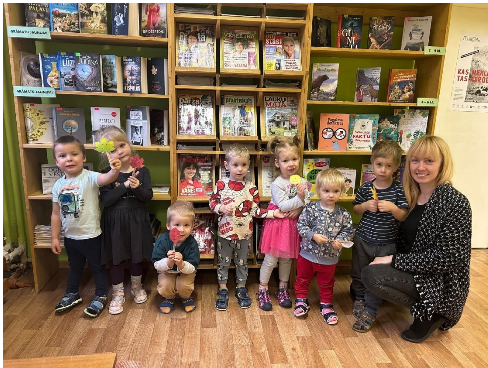
Attēls nr. 1 – PII “Saulīte” Cālīšu grupiņa ar bibliotēkas vadītāju