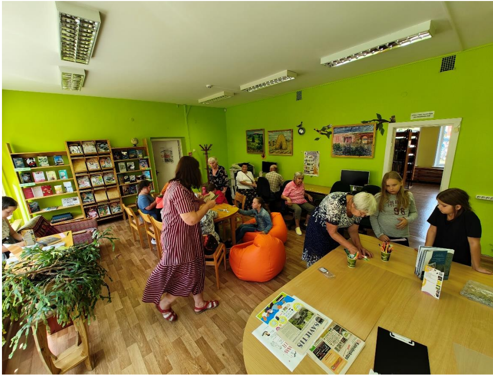
Attēls nr. 7 – Ķeipenes pamatskolas vasaras Vērtību nometnes un konkursa “R.A.D.I. – Ogres novadam” projekta “Esi atbildīgs par tiem, kurus pieradīni” dalībnieki nodarbības laikā