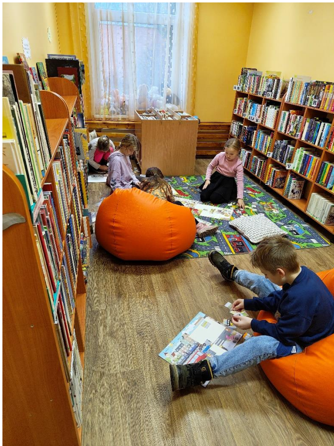
Attēls nr. 2 - Ķeipenes pamatskolas 2.klases skolēni