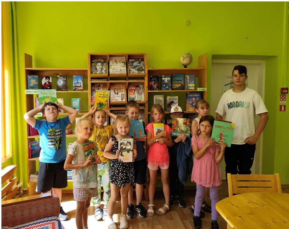
Attēls nr. 8 – Ķeipenes pamatskolas vasaras Vērtību nometnes dalībnieki